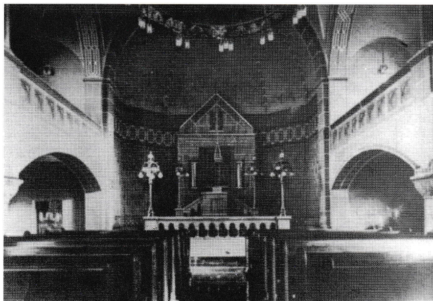
Wittlicher Synagoge, Innenraum vor der Zerstörung und Renovierung

Nazis fanden einen relativ starken Rückhalt im Raum Wittlich, in dem bisher das katholische Zentrum dominiert hatte. Bei der Reichstagswahl vom 5. März 1933 erhielt die NSDAP in Wittlich (Stadt) 1234 Stimmen, d.h. 33,6 % aller Stimmen und belegte damit den 2. Platz nach dem Zentrum, das mit 1594 Stimmen auf 43,3 Prozent aller Stimmen kam (18). Im Kreis Wittlich konnte die NSDAP das Zentrum mit 11.568 Stimmen zu ihren Gunsten gegenüber 11.161 Stimmen für das Zentrum sogar ausstechen, trotz der starken katholischen Gesinnung in der Eifel und an der Mosel. Die Ausführung der zentralen Nazigesetzgebung „klappte“ im ganzen Reich „wie am Schnürchen“, „ganz gleich ob in Berlin, Köln, Bernkastel oder Wittlich“. (19) Am 1. April 1933 begann auf Beschluß der neuen Reichsregierung in Berlin der Boykott jüdischer Geschäfte in ganz Deutschland, der nicht wieder aufgehoben werden sollte. Man erklärte diesen Schritt als Maßnahme gegen die antideutsche Hetzpropaganda in der Auslandspresse. Doch welcher Zusammenhang bestand schon zwischen dem, was ausländische Journalisten über Deutschland berichteten (war es nur die Wahrheit?) und den jüdischen Geschäften in Wittlich? Den Auftakt zu diesem großangelegten Boykott bildeten die Aktivitäten der SA vom 1. April 1933. Frau Grete Bender weiß von diesem Tag zu berichten: „Dann kam der 1. April 1933. Es war ein Samstag, mit aufreizenden Plakaten standen meist junge SA-Leute vor den jüdischen Geschäften und sorgten dafür, daß kein Käufer