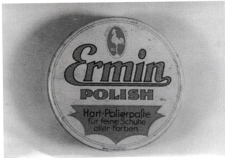
Produkt der Chemischen Fabrik Wittlich