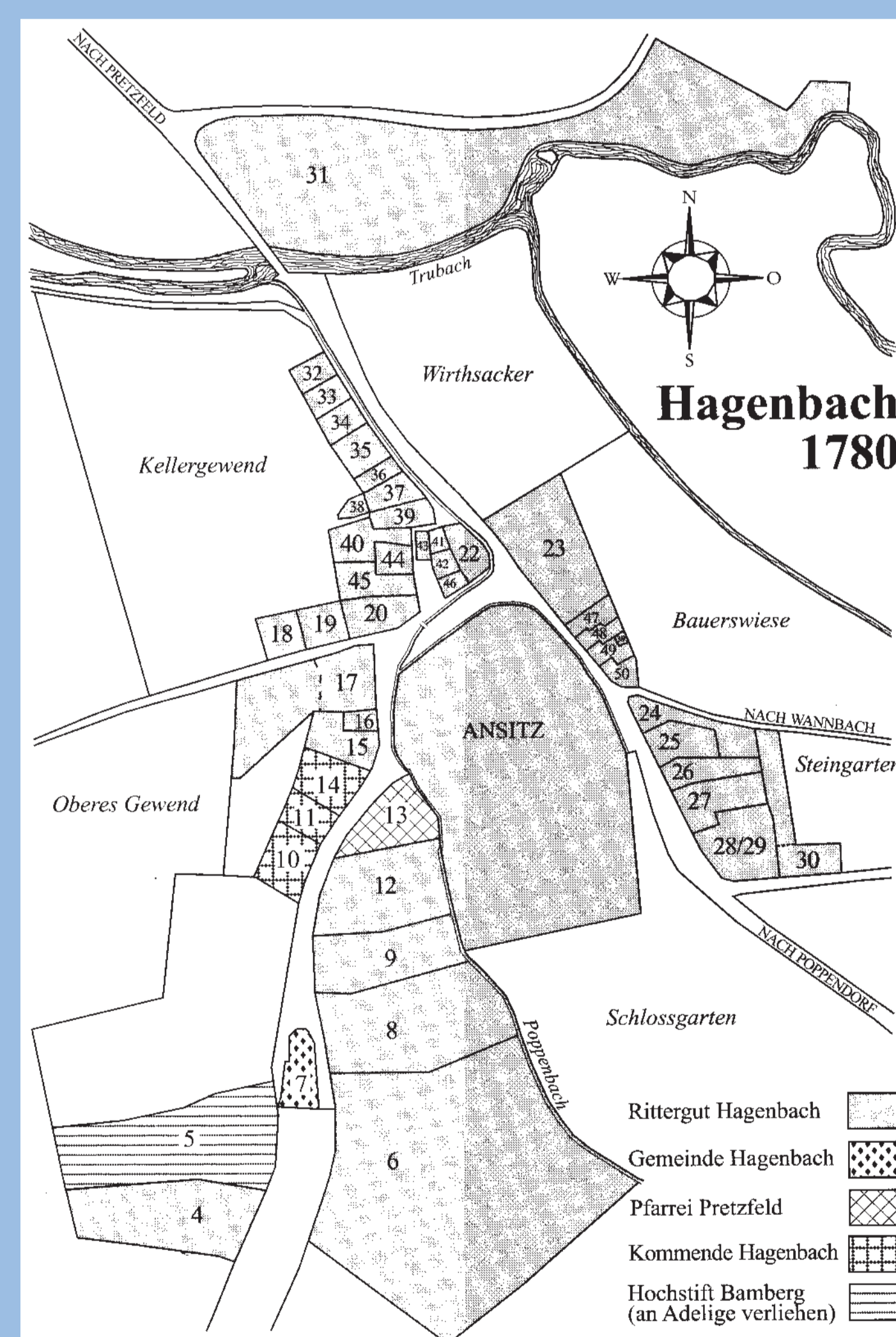
Hagenbach im 16. und 18. Jh. (Zeichnungen: R. Glas)

Lokale Aktionsgruppe Kulturerlebnis Fränkische Schweiz e.V.